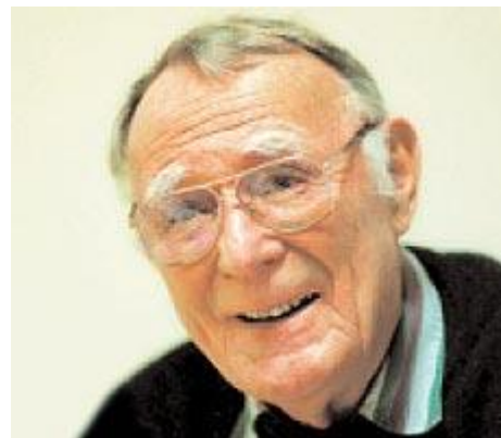
Основатель IKEA Ингвар Камрад

Предлагаемая продукция имела четкие дифференцирующие черты. Все было простым, качественно сделанным, по-скандинавски элегантным. Все продавалось в разобранном виде для самостоятельной сборки покупателями, что снижало цену и срок доставки из магазина (чем отличаются другие мебельные фирмы). Огромные пригородные магазины имели огромные парковки, рестораны, детские игровые комнаты, инвалидные кресла и т.п. Покупатели ожидали стиля и качества по разумным ценам. IKEA реализовала эти ожидания, предоставляя покупателям возможности самостоятельного создания ценности путем исполнения функций, традиционно отдаваемых производителю или продавцу: например, доставка и сборка. Разумеется, это также снижало издержки. Также на это работало и то, что покупателям в торговом зале выдавались бумажные «метры», карандаши и блокноты для записей – требовалось меньше продавцов.